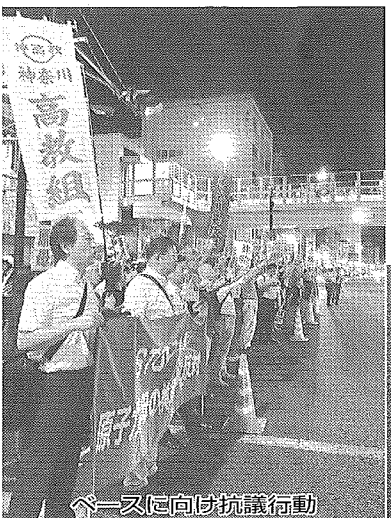
← 一又回向け抗議行動

神高教から、横須賀母港化に抗議する仲間とともに68人が参加しました。集会の後は、市民や米海軍横須賀基地に向け、原子力空母母港化に反対とアピールしながらデモ行進を行いました。